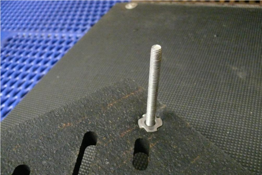
Abbildung 5: Ansicht der Befestigung von unten

Achtung „Fehler bei der Montage vermeiden“: Die Verwendung von weiteren Stiften vor allem an den Ecken ist abzuraten. In diesem Falle ist das Motto „viel hilft viel“ nicht anzuwenden. Warum? Siehe Abbildung „Montage ungeeignet“. Die Stifte sollen nur dafür sorgen, dass die Sau die Matte nicht verschieben kann. Beim Aufstehen oder Positionswechsel kann es jedoch passieren, dass die Sau die Matte an den Enden leicht anhebt. Wie man auf der Abbildung sehen kann, verkanten sich dann die Schrauben/Stifte und die Matte steht über der Liegefläche. Dadurch hat die Sau einen Angriffspunkt und kann die Matte bewegen. Daher ist es wichtig, nur die empfohlenen Punkte in der Mitte zu verwenden, so dass die Matte wieder flach auf den Boden fällt, sollte die Sau sie beim Aufstehen durch Ruderbewegungen hinten oder auch Wühlen vorne leicht angehoben haben.