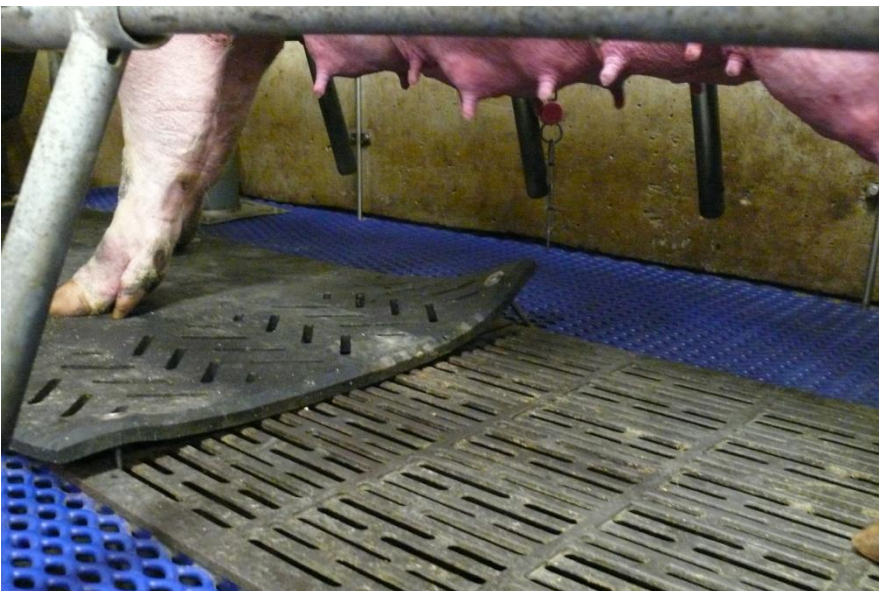
Abbildung 6: Eine falsch montierte Gummimatte wird von der Sau „herausgehobelt“

Achtung „Fehler bei der Montage vermeiden“: Die Verwendung von weiteren Stiften vor allem an den Ecken ist abzuraten. In diesem Falle ist das Motto „viel hilft viel“ nicht anzuwenden. Warum? Siehe Abbildung „Montage ungeeignet“. Die Stifte sollen nur dafür sorgen, dass die Sau die Matte nicht verschieben kann. Beim Aufstehen oder Positionswechsel kann es jedoch passieren, dass die Sau die Matte an den Enden leicht anhebt. Wie man auf der Abbildung sehen kann, verkanten sich dann die Schrauben/Stifte und die Matte steht über der Liegefläche. Dadurch hat die Sau einen Angriffspunkt und kann die Matte bewegen. Daher ist es wichtig, nur die empfohlenen Punkte in der Mitte zu verwenden, so dass die Matte wieder flach auf den Boden fällt, sollte die Sau sie beim Aufstehen durch Ruderbewegungen hinten oder auch Wühlen vorne leicht angehoben haben.