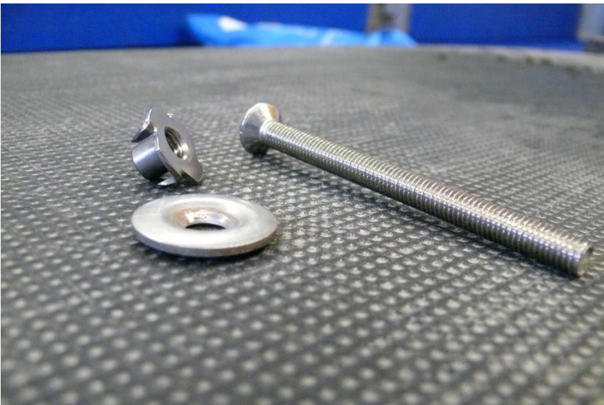
Abbildung 3: Befestigungsmaterial (Schraube, Einschlagmutter und abgerundete Unterlegscheibe)

Mit diesem Werkzeug und Material sind die Gummimatten innerhalb von 5-10 Minuten auf dem Boden fixiert. So schnell lässt sich kein fest installierter Boden auswechseln.