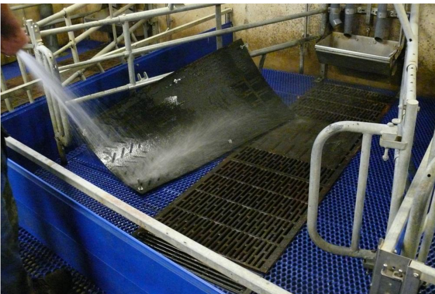
Abbildung 2: Aufrichten der Gummimatte zur Reinigung und Desinfektion

Hierzu bietet die Firma eine Montage-Anleitung an. Im Gegensatz zu den Gummimatten im Deckzentrum oder in der Wartehaltung, die mit Spaltenankern fest am Boden verschraubt werden können, wird die Gummimatte für den Abferkelstall lediglich vor dem Verrutschen gesichert. Damit ist die ungehinderte Reinigung und Desinfektion unter der Matte gewährleistet. Die Matte, wie auch das übrige Abteil und die Einrichtungsgegenstände sollten nach dem Ausstallen und einem Rein-Raus-Verfahren, auch gereinigt und desinfiziert werden. Dazu muss die Matte vom Boden aufgerichtet werden, um diese von unten angemessen reinigen zu können. Das bedeutet, dass bei der Reinigung und Desinfektion ein höherer Arbeitszeitbedarf besteht. Zusätzlich wiegt die verbisschutzoptimierte Matte ca. 20 kg, so dass auch ein gewisser Kraftaufwand zur Reinigung aufgebracht werden muss.