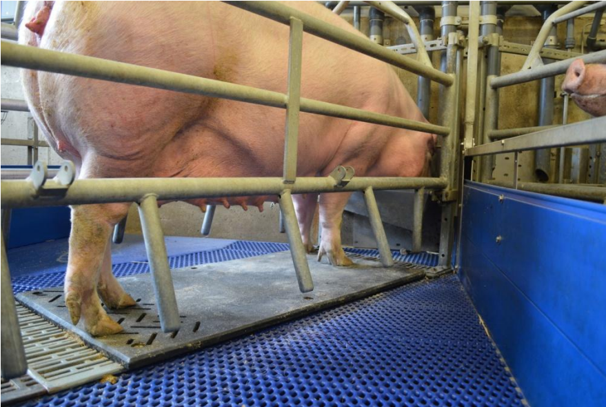
Abbildung 1: Montierte Gummimatte in der Abferkelbucht